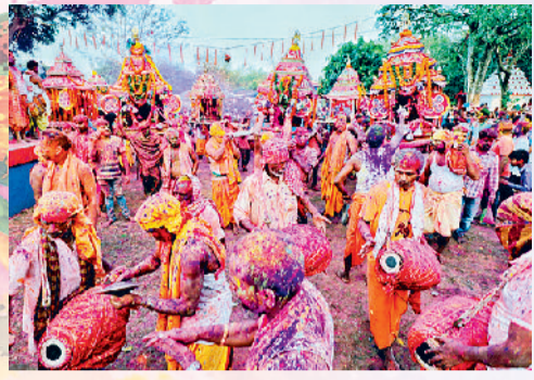
ओडिशा की डोला पूर्णिमा में झूमते लोग