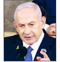
मिलकर ईरान के आतंकी शासन के खिलाफ ऑपरेशन शुरू किया है।

पश्चिम एशिया में अचानक सैन्य तनाव बेहद खतरनाक स्तर पर पहुंच गया है। इजराइल और अमेरिका ने ईरान के खिलाफ संयुक्त सैन्य कार्रवाई शुरू कर दी है। इजराइल के पीएम बेंजामिन नेतन्याहू ने राष्ट्र को संबोधित करते हुए कहा कि यह अभियान ईरान से पैदा हुए अस्तित्व के खतरे को खत्म करने के लिए शुरू किया गया है। इस कार्रवाई ने पूरे क्षेत्र में बड़े युद्ध की आशंका को तेज कर दिया है। नेतन्याहू ने कहा कि इजराइल और अमेरिका ने