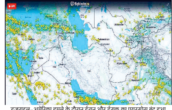
इजराइल-अमेरिका हमले के दौरान ईरान और ईराक का एयरस्पेस बंद हुआ

पश्चिम एशिया में अचानक सैन्य तनाव बेहद खतरनाक स्तर पर पहुंच गया है। इजराइल और अमेरिका ने ईरान के खिलाफ संयुक्त सैन्य कार्रवाई शुरू कर दी है। इजराइल के पीएम बेंजामिन नेतन्याहू ने राष्ट्र को संबोधित करते हुए कहा कि यह अभियान ईरान से पैदा हुए अस्तित्व के खतरे को खत्म करने के लिए शुरू किया गया है। इस कार्रवाई ने पूरे क्षेत्र में बड़े युद्ध की आशंका को तेज कर दिया है। नेतन्याहू ने कहा कि इजराइल और अमेरिका ने