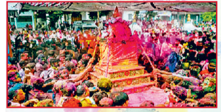
असम का डोल उत्सव

पश्चिम बंगाल की डोल जात्रा: पश्चिम बंगाल में होली को 'दोल पूर्णिमा' या 'दोल जात्रा' कहते हैं। इस दिन स्थानीय लोग राधा और कृष्ण की मूर्तियों को एक पालकी (झूला) में सजाकर घुमाते हैं। लोग केसरिया या सफेद परिधान पहनकर फूलों के गहने धारण करते हैं और 'अबीर' (यहां गुलाब की यही कहते हैं) से खेलते हैं। होली के अवसर पर बंगाल के शांति निकेतन का वसंत उत्सव तो विश्व प्रसिद्ध है। रबींद्रनाथ टैगोर द्वारा शुरू किया गया यह उत्सव नृत्य और रबींद्र संगीत के साथ मनाया जाता है। छोटे बच्चे बड़ों के चरणों में गुलाब लगाकर आशीर्वाद लेते हैं।