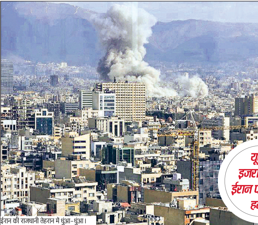
ईरान की राजधानी तेहरान में धुआं-धुआं।

◆ ब्रिटेन बोला- ईरान को कभी भी परमाणु हथियार विकसित करने की अनुमति नहीं दें