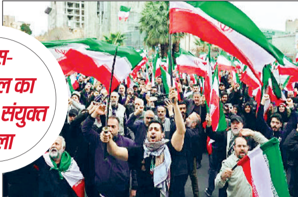
ईरान के नागरिकों ने अमेरिका-इजराइल हमले के विरुद्ध सड़कों पर प्रदर्शन किया