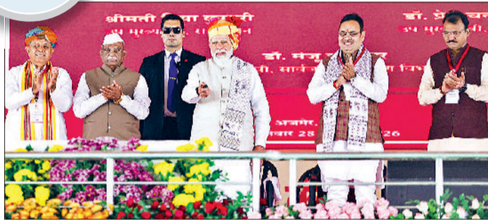
एचपीवी टीकाकरण कार्यक्रम का शुभारंभ करते प्रधानमंत्री मोदी

इस अवसर पर 5 लड़कियों को ह्यूमन पैपिलोमावायरस टीका लगाया गया