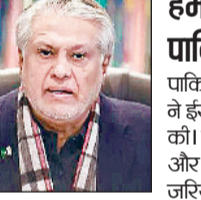
हम ईरान के साथ: पाकिस्तान

नावें के विदेश मंत्री एस्पेन बार्थ ने कहा कि इजराइल के हमले अंतरराष्ट्रीय कानून के अनुरूप नहीं हैं। इजराइल इसे एहतियात के तौर पर किया गया हमला बना रहा है। लेकिन अंतरराष्ट्रीय कानून के तहत एहतियात के तौर पर हमले तभी सही माने जाते हैं, जब खतरा तुरंत और स्पष्ट रूप से सामने हो।