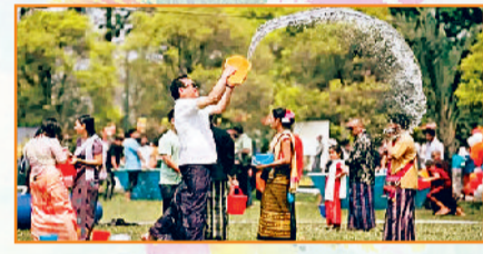
अरुणाचल प्रदेश में मनाते हैं अनेओखी होली सांगकेन

पर्व, भगवान जगन्नाथ (डोला गोविंद) और राधा-कृष्ण को समर्पित है। गांव-गांव में देवी-देवताओं की प्रतिमाओं को सजावटी पालकियों (विमान) में रखकर शोभायात्रा निकाली जाती है। इस दिन मंदिरों में नया 'पंजी' (ओडिशा कैलेंडर) पढ़ा जाता है। लोग पारंपरिक संगीत और मृदंग की थाप पर नृत्य करते हैं। अरुणाचल प्रदेश का सांगकेन उत्सव: यहां होली के आस-पास बौद्ध समुदाय द्वारा 'सांगकेन' मनाया जाता है। यह मुख्य रूप से खामती और सिंगो को जनजातियों का त्योहार है, जो अप्रैल में नए साल के स्वागत के लिए मनाया जाता है। उत्सव के दौरान भगवान बुद्ध की मूर्तियों को मंदिर से बाहर लाकर औपचारिक रूप से पवित्र जल से स्नान कराया जाता है। लोग एक-दूसरे पर