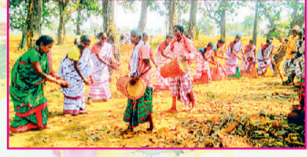
झारखंड की फगुआ होली का आनंद लेते लोग

झारखंड की फगुआ होली: झारखंड में भी होली 'फगुआ' के नाम से मनाई जाती है। इस अवसर पर आदिवासी समुदाय के लोग सेमल की डाली जलाकर उसके चारों ओर नृत्य करते हैं और रंग की जगह लाल मिट्टी या राख का तिलक लगाते हैं। बरही (हजारीबाग) जैसे इलाकों में पत्थरों से होली खेलने की दशकों पुरानी परंपरा है। स्थान समुदाय में इस दौरान 'बाहा' उत्सव मनाया जाता है, जिसमें फूलों और फलों को अर्पित कर प्रकृति के साथ खुशियां मनाई जाती हैं। झारखंड की होली में धुस्का, अरसा रोटी और मालपुआ मुख्य रूप से