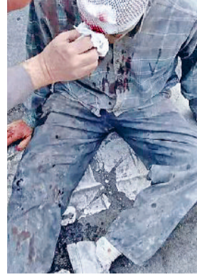
हमले में घायल ईरानी नागरिक