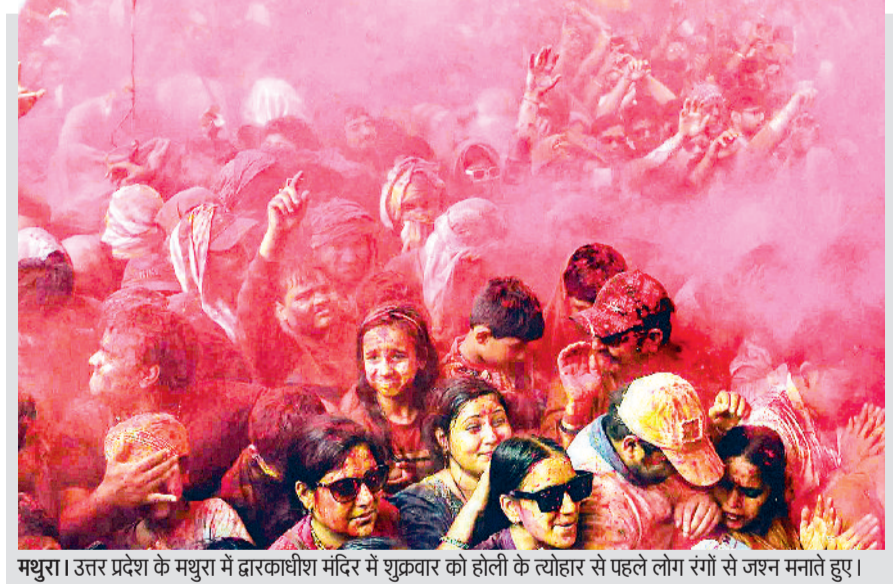
मथुरा। उत्तर प्रदेश के मथुरा में द्वारकाधीश मंदिर में शुक्रवार को होली के त्योहार से पहले लोग रंगों से जश्न मनाते हुए।