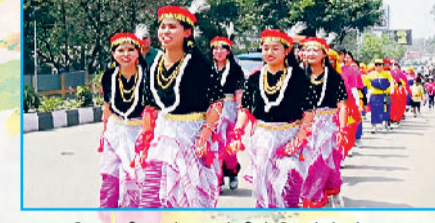
मणिपुर की याओसांग होली में दिखते हैं लोकंग

पकाए-खाए जाते हैं। मुख्य होली के अगले दिन बुजुगों के सम्मान में झारखंड के कई हिस्सों में 'बुढ़वा होली' मनाई जाती है, जिसमें फगुआ मंडलियां घर-घर जाकर गायन करती हैं। उत्सव के दौरान मस्ती को बढ़ाने के लिए दुध, मेवे और भांग से बनी टंडाई का सेवन किया जाता है।