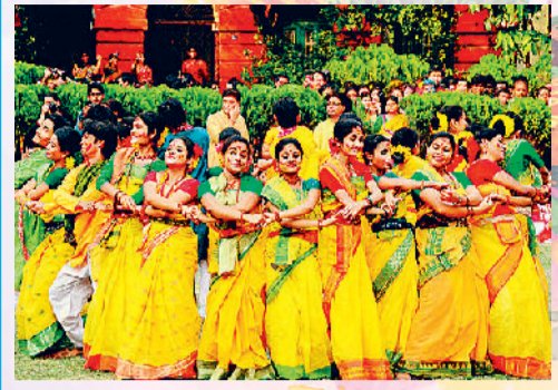
शांति निकेतन का विश्व प्रसिद्ध बसंत उत्सव