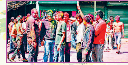
त्रिपुरा में पारंपरिक तरीके से मनाते हैं होली

मणिपुर की याओसांग होली: मणिपुर में 6 दिनों तक चलने वाली याओसांग होली, थबल चोंगबा नृत्य और पारंपरिक लोक गीतों के साथ मनाई जाती है। यह होली स्थानीय परंपराओं और हिंदू धर्म का एक खूबसूरत मिश्रण है। मणिपुरी युवा पारंपरिक गीतों और ड्रम की थाप पर थबल चोंगबा लोक नृत्य करते हैं। पहले दिन पुआल से बनी एक छोटी झोपड़ी जलाई जाती है, जिसे 'याओसांग में देवा' कहते हैं। इस अवसर पर बच्चे घर-घर जाकर दान मांगते हैं, जिसे 'नाकाथंग' कहा जाता है। मणिपुर में इस दौरान खेलकूद का आयोजन भी किया जाता है।